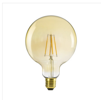
XLED G125 7W