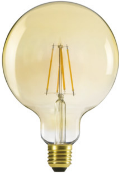
XLED G125 7W