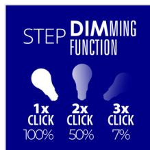
XLED A60 7W-STEPDIM