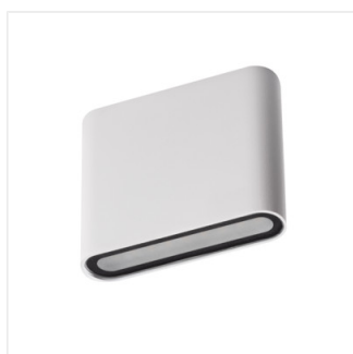
GARTO LED EL 8W-W