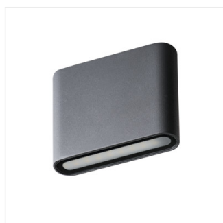
GARTO LED EL 8W-GR