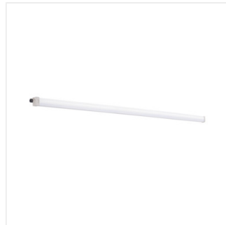
TP SLIM LED 50W-NW