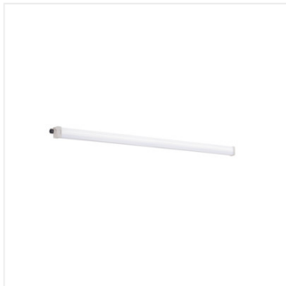
TP SLIM LED 40W-NW